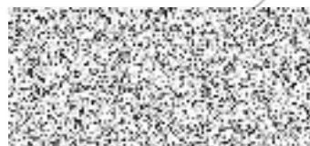
Fotbalový klub Tachov, z.s., zastoupený Petrem Mží tajemníkem klubu