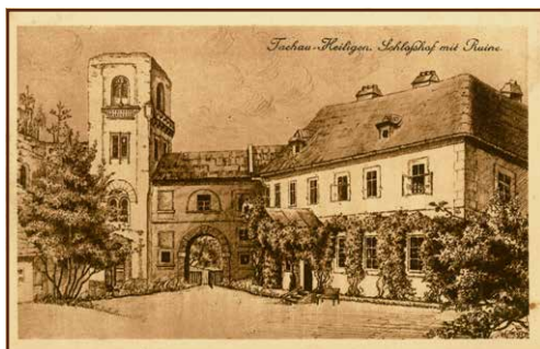
Světce na staré pohlednici