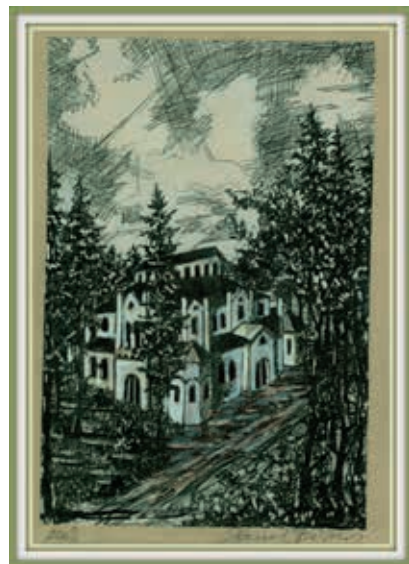
Jízdárna ve Světcích

Zadní strana obálky: Tachovské náměstí, autor obrazu Vladislav Barcal