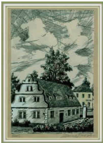
Bývalý vodní mlýn v Tachově