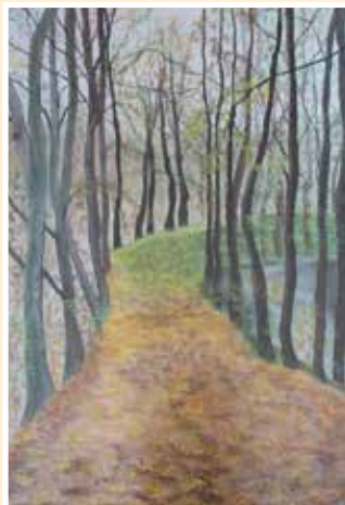
Alej u Mže