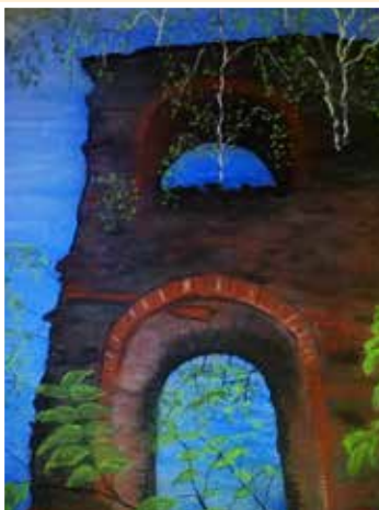
Ruiny na Svaté