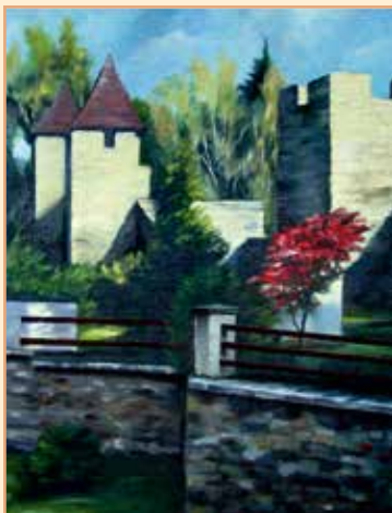
Tachovské hradby (2007)