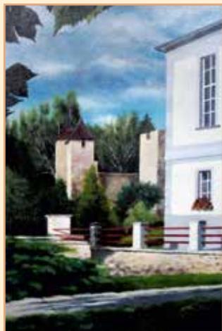
Okno zámecké paní (2006)