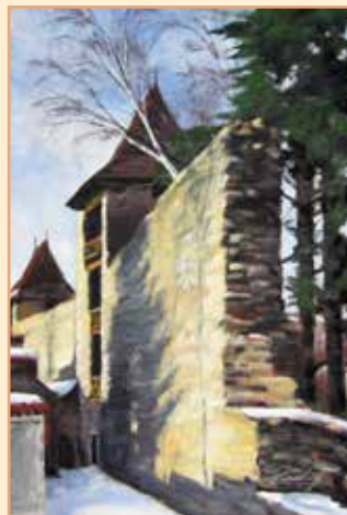
Tachovské hradby (2007)

Přední strana obálky: foto Slavomír Štrobl