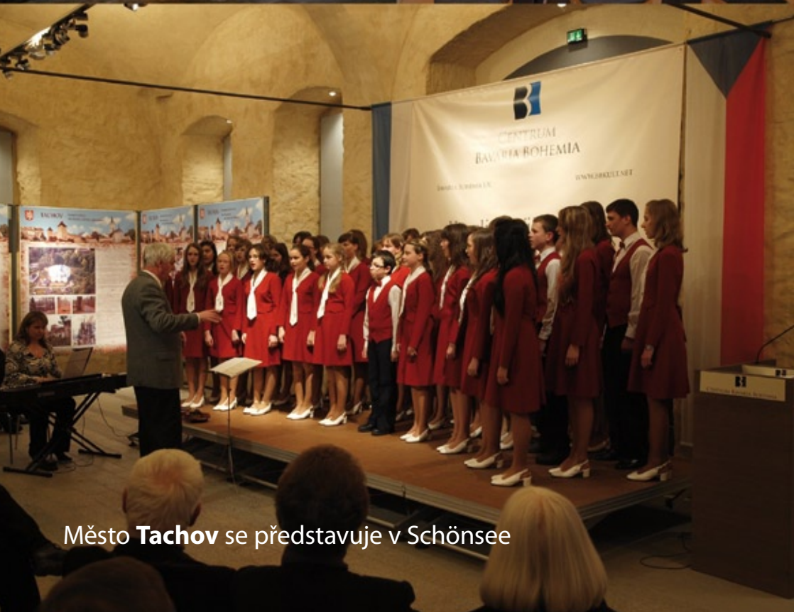
Město Tachov se představuje v Schönsee