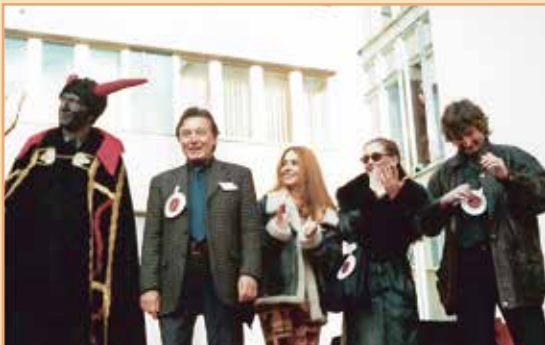
Největší slávou byla předpremiéra filmu Z pekla štěstí II s Karlem Gottem v roli Pána Boha a Lucifera. (2001)