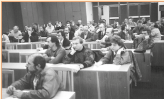
Historický snímek. V těchto místech je dnes hlediště. (1990)