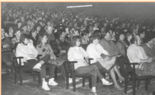
Zahájení provozu kina Mže v Hornické ul. (24. 5. 1991)