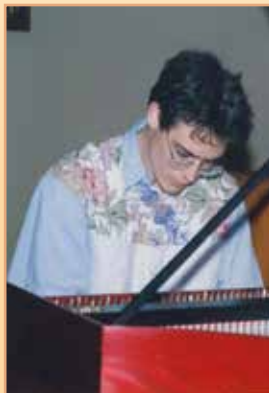
Kristian Nyguist cembalista, USA - 1992