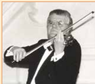
Hostem jubilejního 100. koncertu KPH byl 13. 12. 1985 houslista, národní umělec Josef Suk