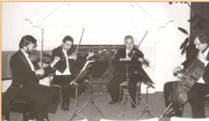
Dimovo kvarteto – Bulharsko, 1986