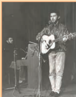
Marek Eben jako folkový zpěvák – 1990