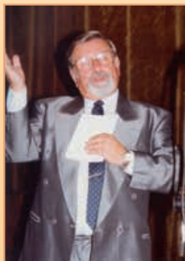
Spisovatel František Nepil - 1993