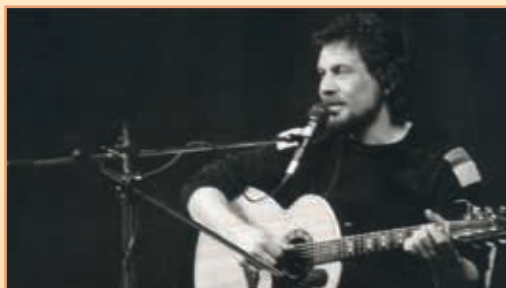
Populární folkový zpěvák Wabi Daněk