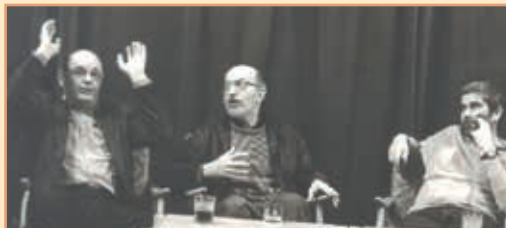
Filmový režisér Václav Vorlíček a scénárista Miloš Macourek – 1989