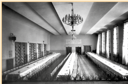
Kapacita při stolovém uspořádání 475 osob – pohlednice z roku 1973.