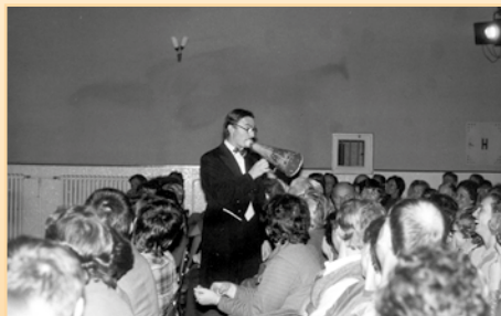
Originální pražský synkopický orchestr s Ondřejem Havelkou - 13. 11. 1985