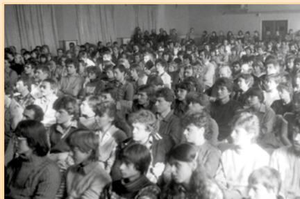
Kapacita při koncertech 650 sedících diváků. Oblastní kolo Porty z roku 1984